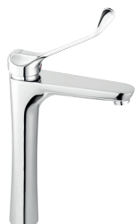
Álló magasított orvosi mosdócsaptelep króm