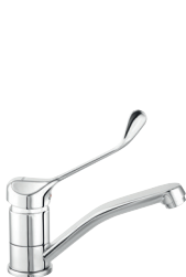
Álló orvosi mosdócsaptelep elforgatható kifolyóval króm