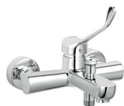
Fali orvosi kádcsaptelep króm