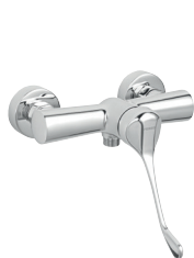
Fali orvosi zuhanycsaptelep króm