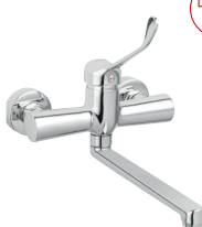
Fali orvosi mosogató csaptelep króm