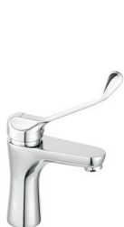
Álló orvosi mosdócsaptelep króm