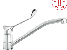
Álló orvosi mosogató csaptelep króm