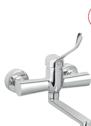
Fali orvosi mosdócsaptelep króm